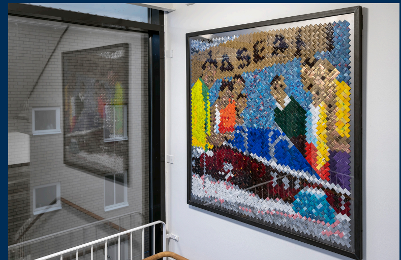
Bilder: Detaljer av Ne Jotka Tulivat Me Jotka Jäimme / Dom Som Kom Vi Som Blev av Lisa Juntunen Roos, 2022 © Lisa Juntunen Roos/Bildupphovsrätt 2023 Foto: Bo Gyllander